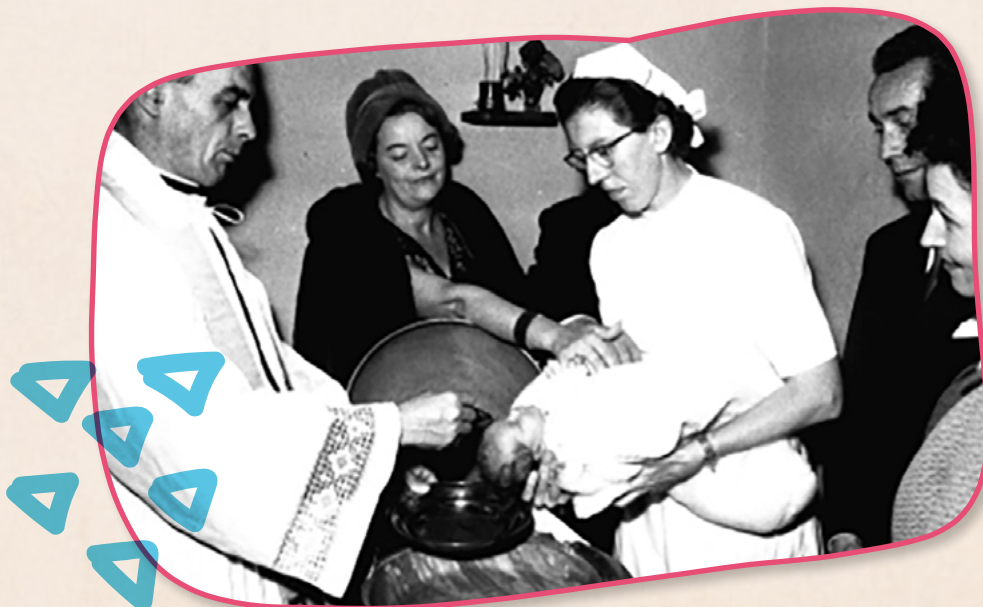
Bai der Kanddaf, huet d'Hiewan de Puppelchen ugehal