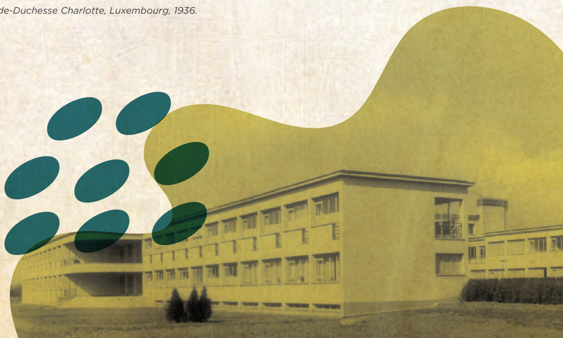
Maternité Grande-Duchesse Charlotte, Luxembourg, 1936.

Hautzedaags kann eng Hiewan ënnert aneren an enger Maternité schaffen, oder och selbststänneg als fräischaffend Hiewan an hirer Praxis a bei de Leit doheem.